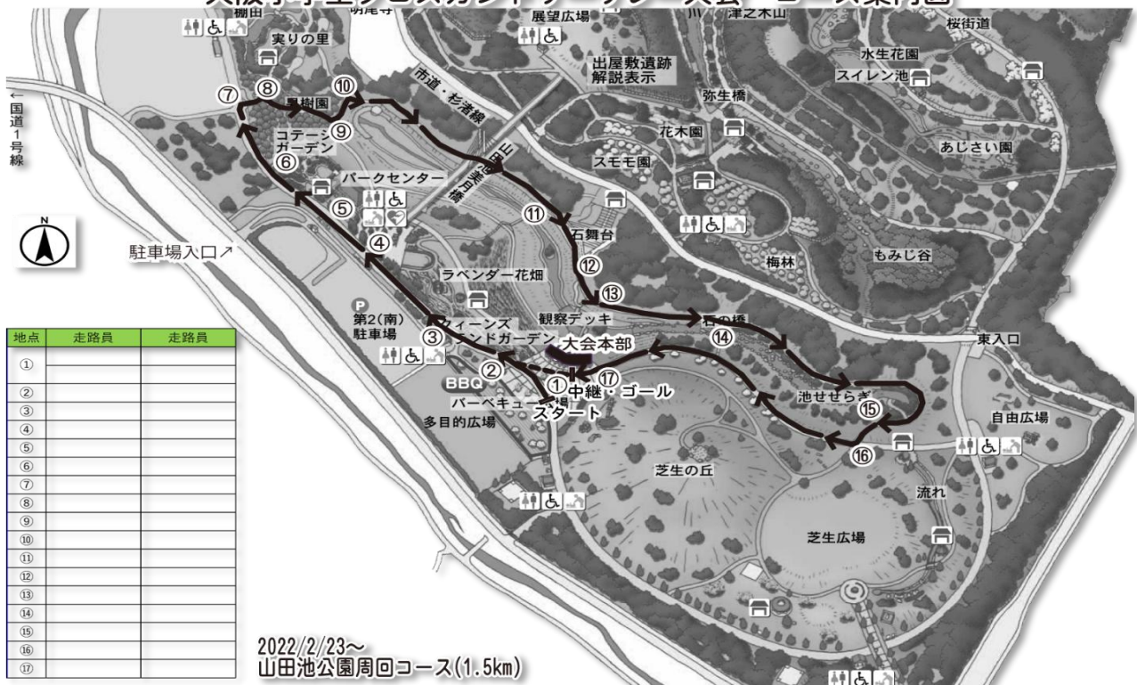
大阪小学生クロスカントリーリレー大会 コース案内図